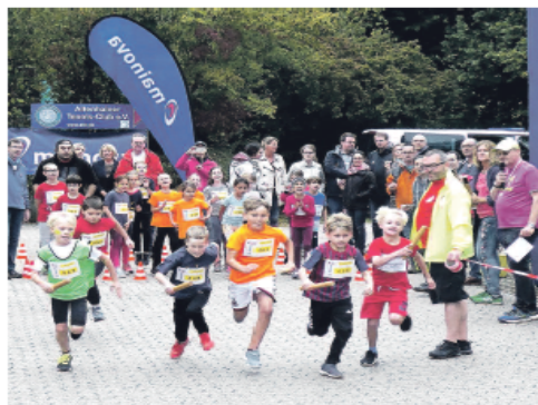
Start Staffellauf - 3. Grundschulklassen

Wuzzelauf-Angebote erneut mit Staffelläufen der Grundschulklassen 1-4 / sehr attraktive Preise für alle Sieger der Wettbewerbe Die Verantwortlichen hatten sich