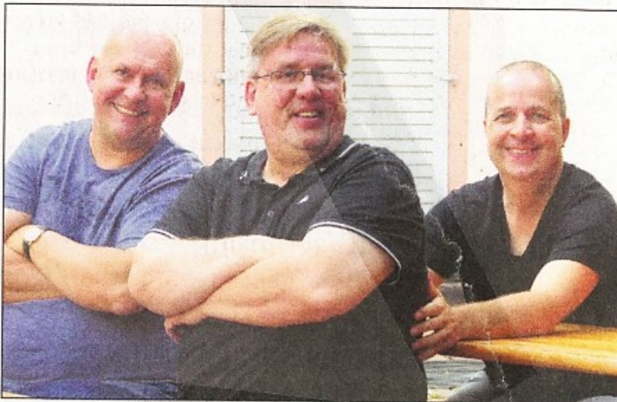
Die Band „Third Man Lost“

Infos: www.tsg-altenhain.de , www.thomwalther.de