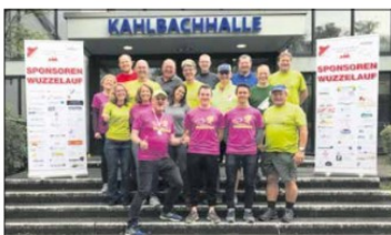
Das Helferteam der TSG-Altenhain

Bei der Halbmarathonwertung kommen bei dieser einzigartigen Lauferie 62,2 km und 1.098 Höhenmeter zusammen. Rund die Hälfte der Läufer war auf den traditionellen Strecken 10 km und der mit 343 Höhenmetern sehr harten Halbmarathonstrecke von 21,1 km unterwegs. Erfreulich ist auch die Anzahl der teilnehmenden Kinder aufgrund des neuen Angebotes der Staffelläufe entwickelt.