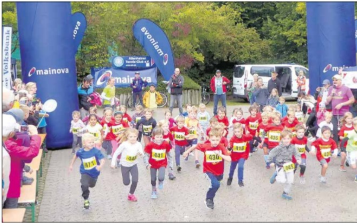
Der Start des Kinderlaufs bis 6 Jahre

Premiere in Altenhain: Man musste tatsächlich elf Jahre warten, bis bei der 12. Auflage der Altenhainer Wuzzelauf mindestens auf Teilstrecken der Feldwegstrecken im Sinne von „Nomen est Omen“ seinem Namen als „Wuzzelauf“ gerecht werden konnte. Der Wettergott meinte es wirklich nicht gut am Sonntag, und auch schon beim Aufbau am Samstag und dann am Lauftag selbst konnten Dauerregen, der natürlich eine Vielzahl von Läufern abhielt, sich den Laufstrapazen in Altenhain aussetzen.