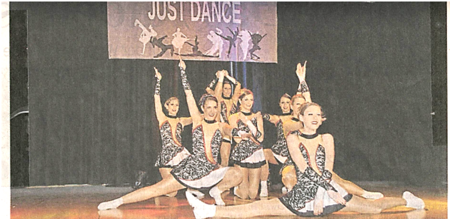
Stolz zeigen die Tänzerinnen bei der Tanzgala „Just Dance“ ihr Können.