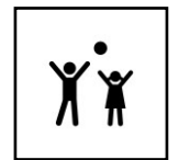
Krabbeln/ Mutter Kind