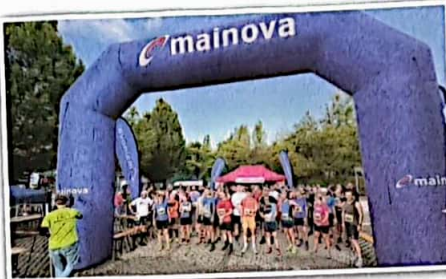
Kurz vor dem Start um 9.00 Uhr