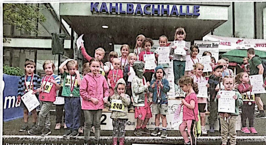
Dutzende Sieger des Kinderlaufes alle mit Urkunde, Medaille und T-Shirt