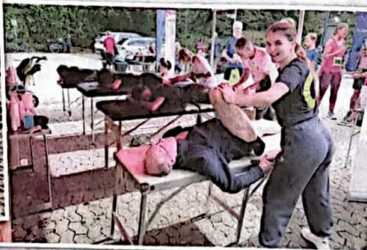
Das Physio plus Team bei der Massage-Arbeit

„Der Wuzzelauf ist zurück“. Endlich nach zwei Jahren Corona-bedingter Zwangspause konnte am vergangenen Sonntag zwischen 8:00 und 12:00 Uhr bei teilweise sehr ungunstigen Laufbedingungen der 13. Wuzzelauf stattfinden – leider mit einem Teilnehmerrückgang von im Vorjahr 272 auf aktuell 219 (in 2018 bei top Wetter noch 374 Läufer).